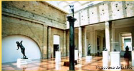
Pinacoteca do Estado