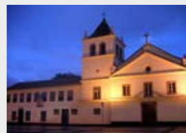
Pateo do Collegio

O mundo passa pelo Centro cosmopolita de São Paulo; homens de negócios apressados para o pregão da Bolsa ou grupos de punks atrás da última novidade em música. São turistas de todos os cantos misturados a moradores de todas as origens. No Pateo do Collegio, São Paulo foi fundada em 1554. Vale visitar também o Solar da Marquesa de Santos. Também no Centro Velho está a Praça da Sé. O Viaduto do Chá marca a transição para o Centro Novo. Em torno da Praça da República, edifícios registram diferentes fases da arquitetura. Os fãs de música clássica têm dois endereços tradicionais: o Theatro Municipal e a Sala São Paulo, na antiga Estação Júlio Prestes. No teatro e na sala, há visitas guiadas, que devem ser agendadas. Para compras, a rua 25 de Março e o Bom Retiro estão entre os endereços preferidos.