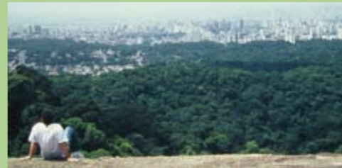
Vista da Serra da Cantareira