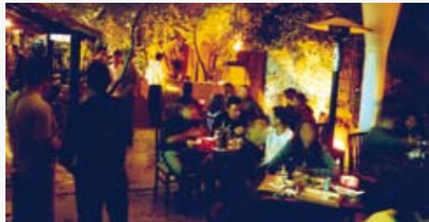
Bar em Pinheiros