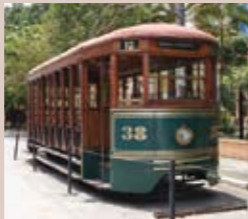
Bonde do Memorial do Imigrante

Fundada em 25 de janeiro de 1554 pelos jesuítas Manuel da Nóbrega e José de Anchieta, passou 300 anos quase sem moradores. A arrancada foi no século 19, com o café tomando a dianteira da produção brasileira. As ferrovias do interior se encontravam justamente em São Paulo. Os ingleses, então, construíram a Estação da Luz. Começavam a chegar os imigrantes: italianos, alemães, japoneses, espanhóis, portugueses etc. Na década de 20, a cidade ganhou bonde elétrico e expandiu a indústria têxtil; em 1922, foi palco da Semana de Arte Moderna; nos anos 60, dos festivais da canção onde nasceram grandes nomes da MPB. Em 1996, o SP Fashion Week passa a levar a moda brasileira ao mundo. E a vanguarda, a cultura e as histórias de sucesso tornam-se parte definitiva da vida da metrópole.