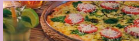
Pizza: essencial ao Paulistano