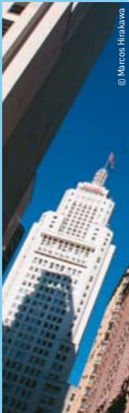
Edifício Altino Arantes

Fundada em 25 de janeiro de 1554 pelos jesuítas Manuel da Nóbrega e José de Anchieta, passou 300 anos quase sem moradores. A arrancada foi no século 19, com o café tomando a dianteira da produção brasileira. As ferrovias do interior se encontravam justamente em São Paulo. Os ingleses, então, construíram a Estação da Luz. Começavam a chegar os imigrantes: italianos, alemães, japoneses, espanhóis, portugueses etc. Na década de 20, a cidade ganhou bonde elétrico e expandiu a indústria têxtil; em 1922, foi palco da Semana de Arte Moderna; nos anos 60, dos festivais da canção onde nasceram grandes nomes da MPB. Em 1996, o SP Fashion Week passa a levar a moda brasileira ao mundo. E a vanguarda, a cultura e as histórias de sucesso tornam-se parte definitiva da vida da metrópole.