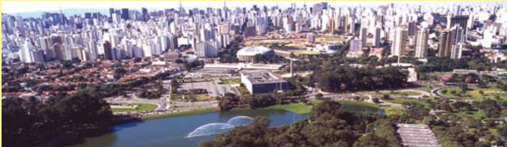
Parque do Ibirapuera