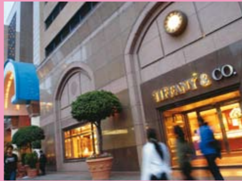
Lojas para todos os gostos

São Paulo é o paraíso dos compradores. A cidade tem 240 mil lojas, 66 shoppings e 59 ruas temáticas, de bijuterias a grifes internacionais, passando por uniformes, móveis, antiguidades, instrumentos musicais e até discos de vinil. Pode-se investir fortunas numa camiseta italiana autêntica ou partir para o atacado em bairros como Bom Retiro, Brás e Itaim-Bibi. O Bom Retiro é forte em confecções femininas. No Brás, compre jeans ou enxovais. E no Itaim-Bibi, especialmente ao longo da rua João Cachoeira, e em Moema, na rua Bem-te-vi, há pontas de estoque excelentes. Atacadistas não saem da rua 25 de Março, no Centro. Tem de tudo. São Paulo é a única cidade sul-americana com duas lojas Tiffany & Co. Aqui, encontra-se toda a coleção Giorgio Armani, relógios Bulgari, malas Louis Vuitton, lustres Baccarat ou ternos Ermenegildo Zegna. Todas essas lojas se concentram nos arredores da rua Oscar Freire, nos Jardins, no Shopping Iguatemi, ou na Daslu.