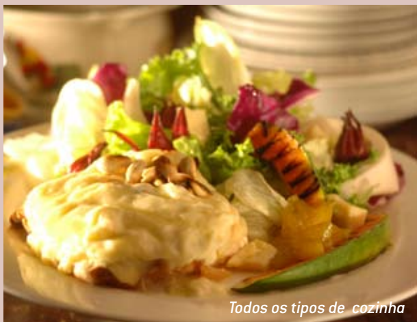
Todos os tipos de cozinha

Nada é mais cosmopolita que a gastronomia de São Paulo. A cidade nos deixa com água na boca com seus 12.500 restaurantes, chefs aclamados e ambientes sofisticados. A qualquer momento, pratos de 52 nacionalidades – como alemã, árabe, armênia, chinesa, coreana, escandinava, espanhola, francesa, grega, indiana, italiana, japonesa, marroquina, mexicana, portuguesa, tailandesa, russa e israelita – estão na mesa. Isso sem mencionar os diversos estilos de cozinha nacional – da feijoada ao churrasco, de comida mineira à baiana. Há ainda um prato que agrada tanto moradores como visitantes: a pizza.