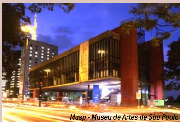
Masp - Museu de Artes de São Paulo

Os museus de São Paulo possuem diversas coleções de arte nacional e internacional. O Masp, uma construção audaciosa com o maior vão livre do mundo, apresenta um acervo que inclui trabalhos de artistas como Rafael, Botticelli e Ticiano da escola italiana; Delacroix, Monet, Manet, Degas, Cézanne, Renoir, Van Gogh, Matisse, Toulouse-Lautrec, Modigliani e Chagall, da escola Parisiense, bem como os maiores nomes da arte brasileira.